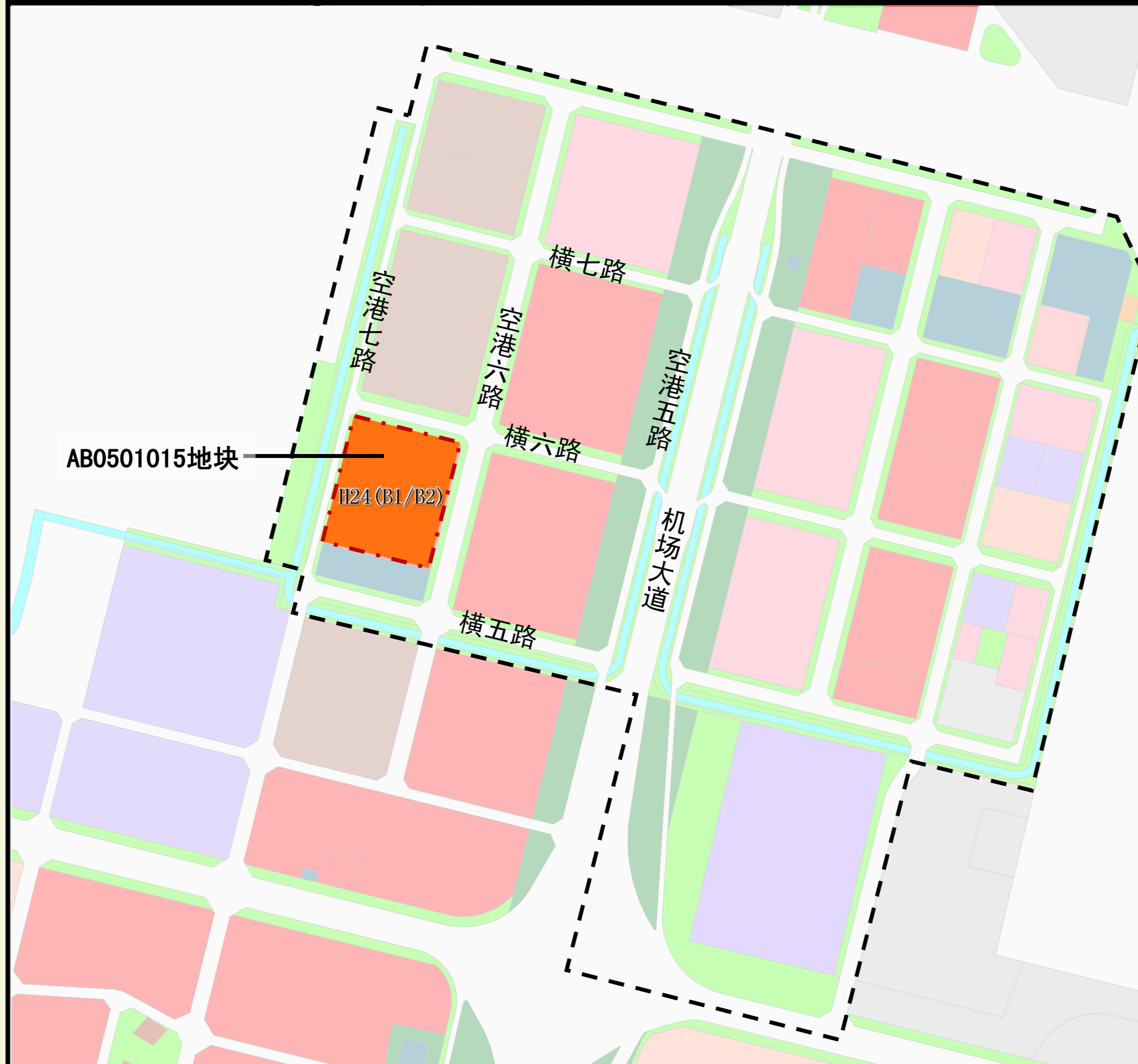
优化后规划示意图