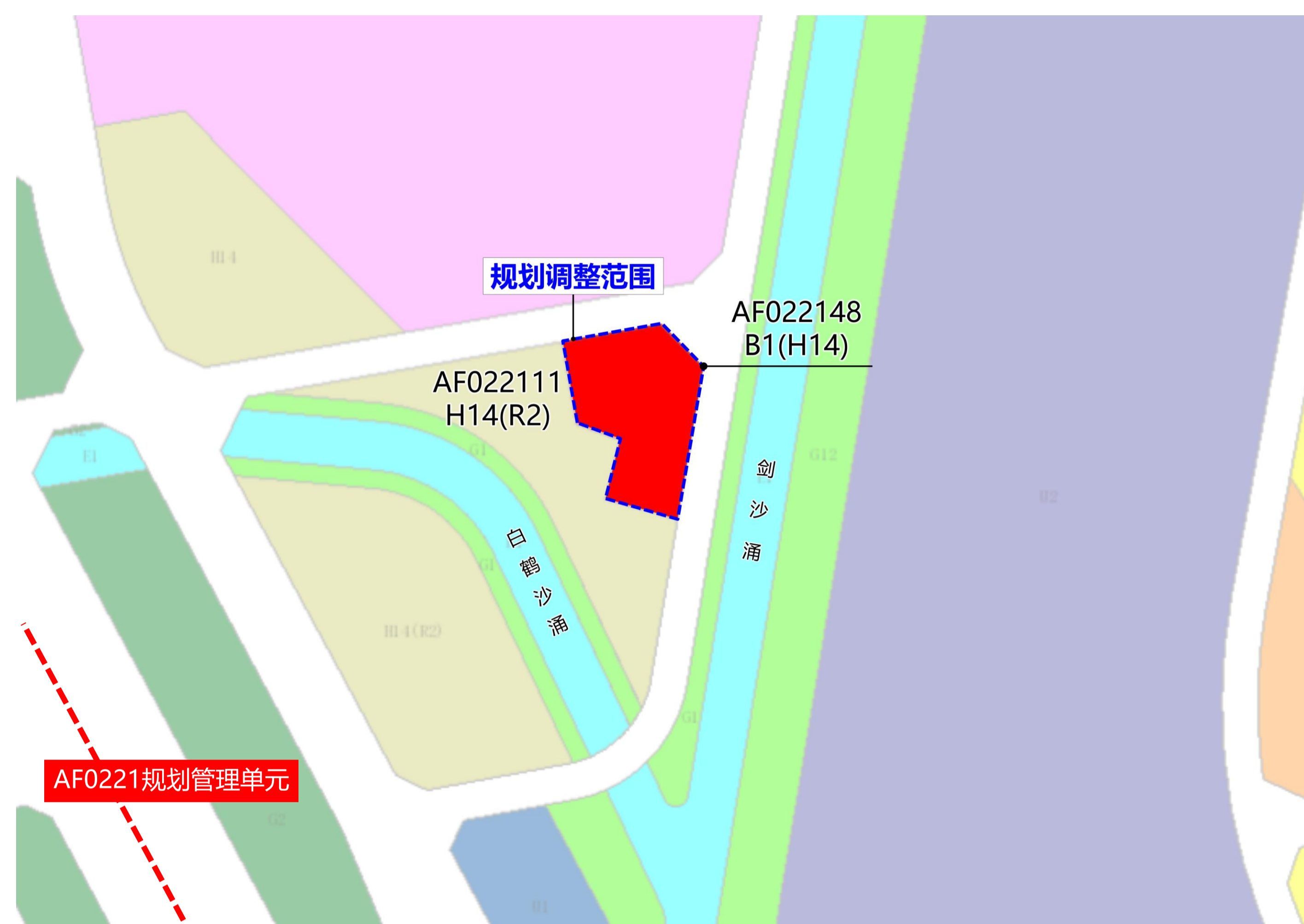
调整前规划示意图

http://ghzyj.gz.gov.cn/ywpd/cxgh/ghzdhxg/