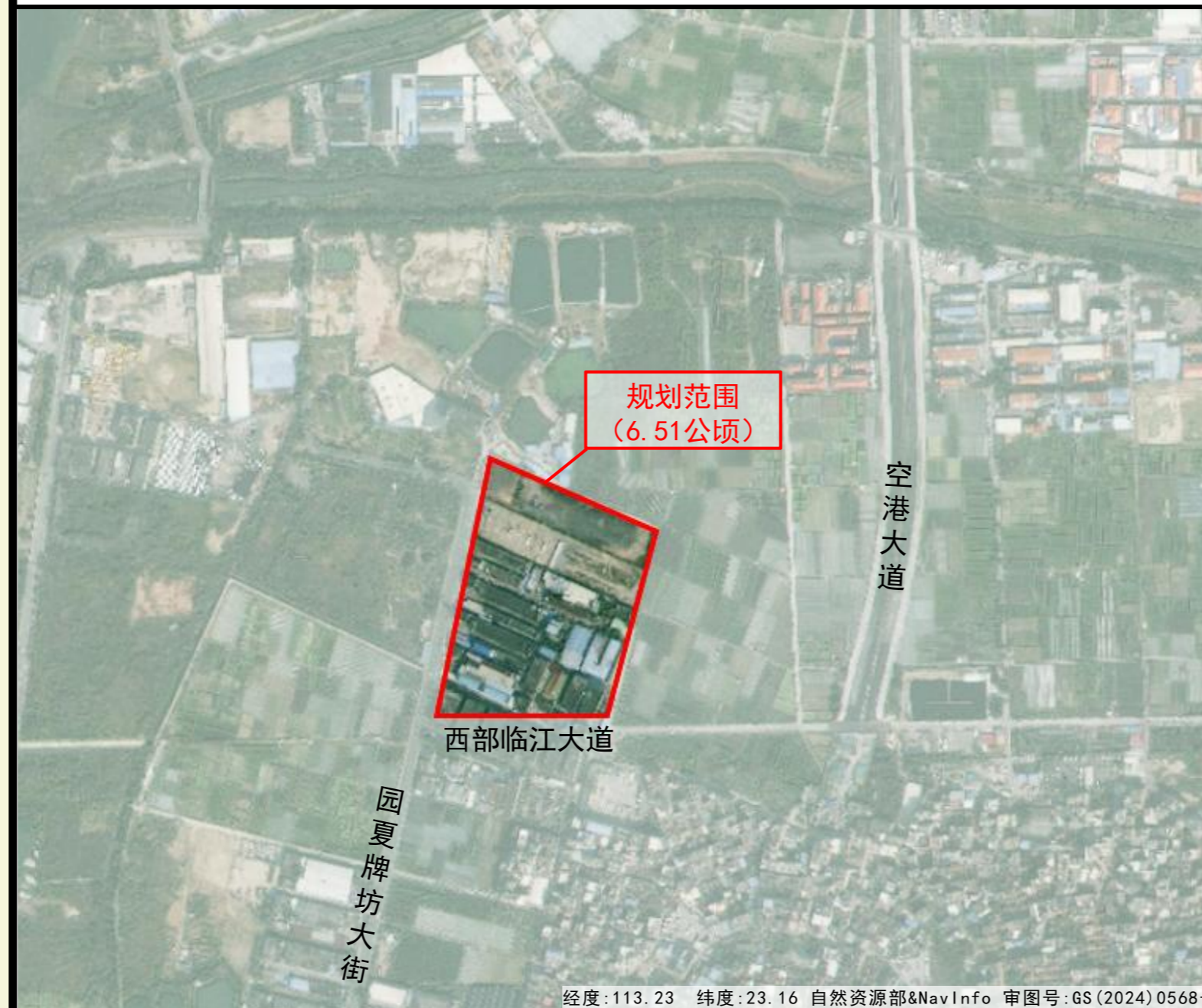
龙归园夏牌坊大街产业区块原规划示意图