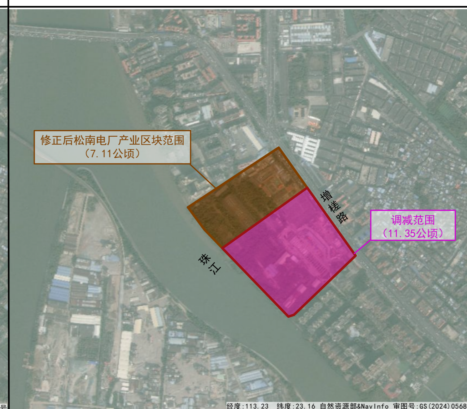
松南电厂产业区块拟优化规划草案示意图