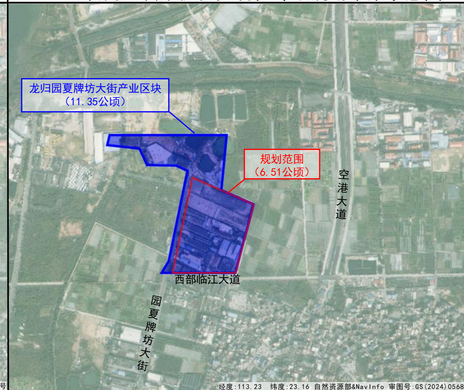
龙归园夏牌坊大街产业区块拟优化规划草案示意图