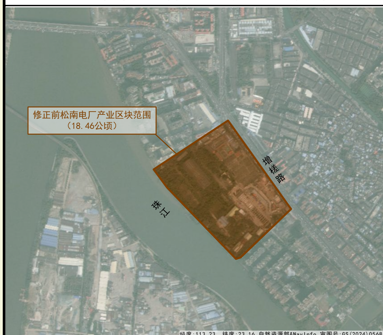
松南电厂产业区块原规划示意图