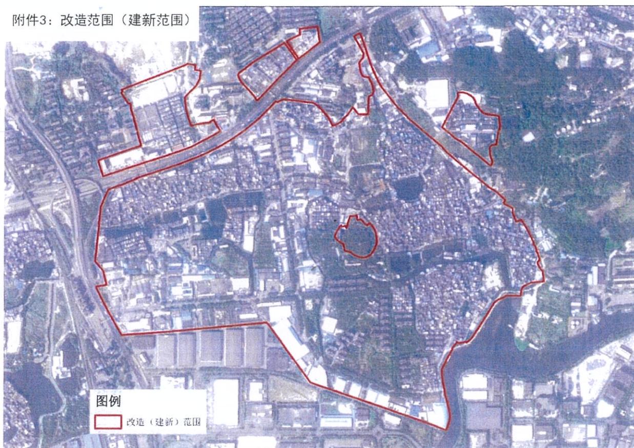
附件3：改造范围（建新范围）