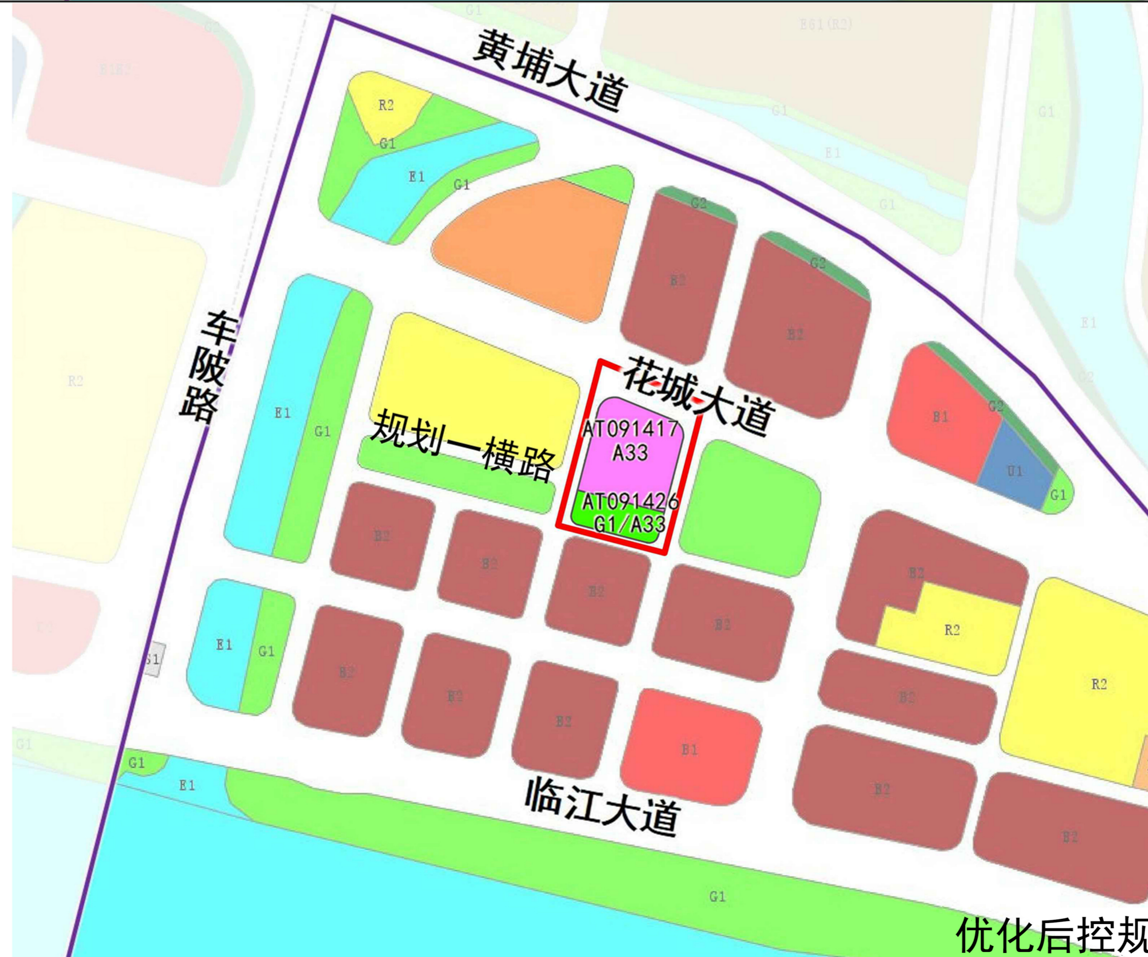
优化后控规示意图